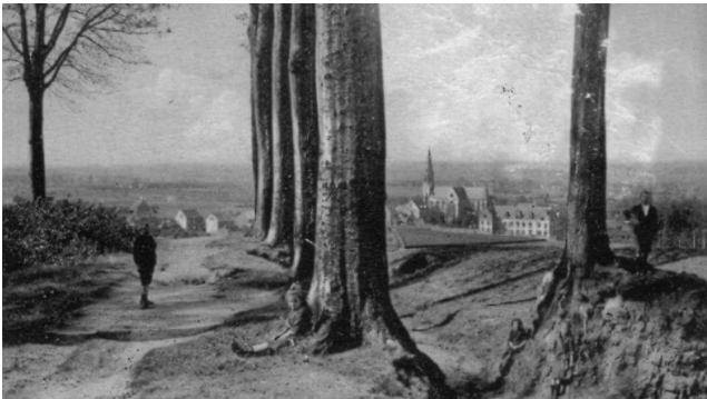
Zicht vanaf 'den berg'

Één van de belangrijkste erfgoederen van Pamel is (of was) de Ledeberg met zijn bomen en zijn mooi uitzicht. Van deze unieke plaats die in de wijde omtrek zeer gekend en geapprecieerd werd is helaas niet veel overgebleven. Dit uitzicht werd met ontroering beschreven door één van onze grootste Vlaamse dichters, Karel Van de Woestijne, toen die in 1913 ten huize van dr. Gustaaf Borginon verbleef: "Daar, op Pamel'sche hillen, in de subtiele, vertederde najaarslucht, met onder zich de, thans naakte, akkers die blauwend te ademen liggen, waar alleen nog het lichte groen der beten helder leeft in de wazige verten, doorflitst, hier en daar, bij den spiegel der kronkelende Dender, - daar voelt men zijn hart dat aldus sedert alle eeuwen aldus moge blijven voortkloppen..."