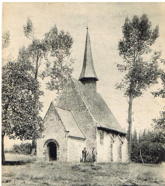
Kapel van de Woestijn

De Woestijkapel lag op de bedevaartsroute naar Compostella. Zij wordt vernoemd vanaf de 14 de eeuw, de huidige kapel werd opgetrokken in 1600. De naam is afgeleid van wastenije , een onbebouwde woestyn waar men tot honderd jaar geleden enkel grazend vee aantrof. Volgens de legende werd een koperen kruisbeeld gevonden door een herder. Hij droeg het naar de parochiekerk van Gooik. Maar o wonder 's anderendaags was het kruis verdwenen. Het prijkt sindsdien weer op de Woestijnheuvel. Bruegel zou de Woestijkapel als achtergrond hebben afgebeeld op zijn schilderijen. De sleutel van de kapel en het Heilig Kruis werden bewaard op de Brabantse vierkanthoeve van de Walravensstam, een naam die men in haast iedere Pajotse stamboom tegenkomt.