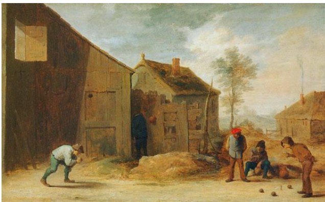
David Teniers, 1680

Wanneer een bol verrassend op het middelpunt van het stek valt, neemt iedereen de mooie, poëtische lofcreet "Zjou" in de mond, wat vaak leidt tot lichtjes verontrustende trillingen van de golfplaten die de bollebaan voor barre weersomstandigheden moeten beschutten.