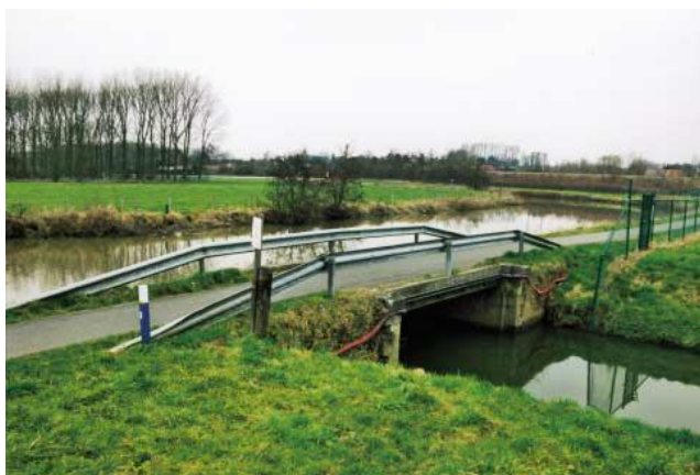
De monding van de Bellebeek in de Dender

Vanaf de Bellemolen in Essene heet de beek de Bellebeek en vloeit zij ter hoogte van Teralfene in de Dender (foto) waar zij zorgt voor een belangrijk debiet (een tiende van het Denderbekken!). Haar oorspronkelijke oude naam is Alfene. De Kelten gaven de naam Alfene (=de witte) waarvan verschillende benamingen zijn afgeleid: Teralfene, (in Sint-Katherina-Lombeek het bos van) Overalfene en (in Ternat twee gehuchten) Opalfene en Neeralfene. De Dender doopten ze met de naam Tanera (= de bruisende). De latere naam Bellebeek is afgeleid van de watermolen de Bellemolen.