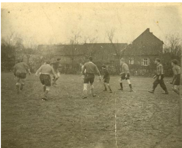
De Denderzonen aan de Keer, 1941